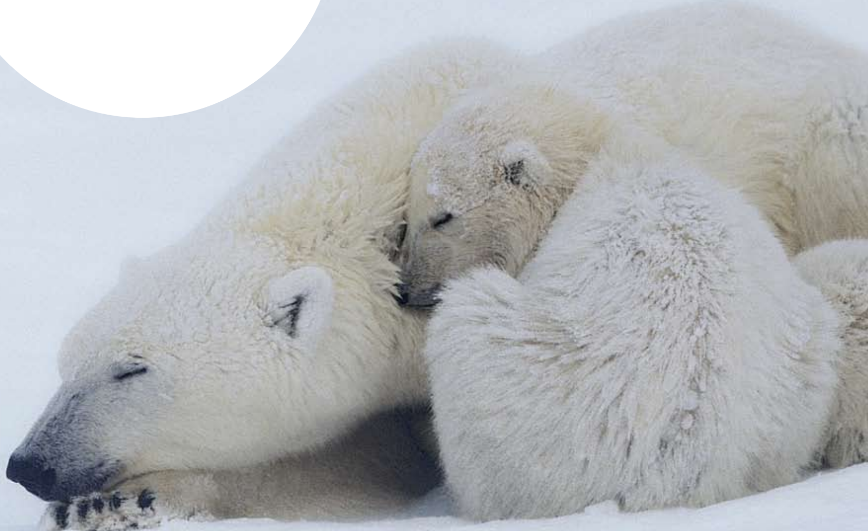
Een van de hoofdrolspelers uit de film Earth: moeder ijsbeer met haar jong

‘Onze stijl van leven heeft invloed tot op de Noordpool’